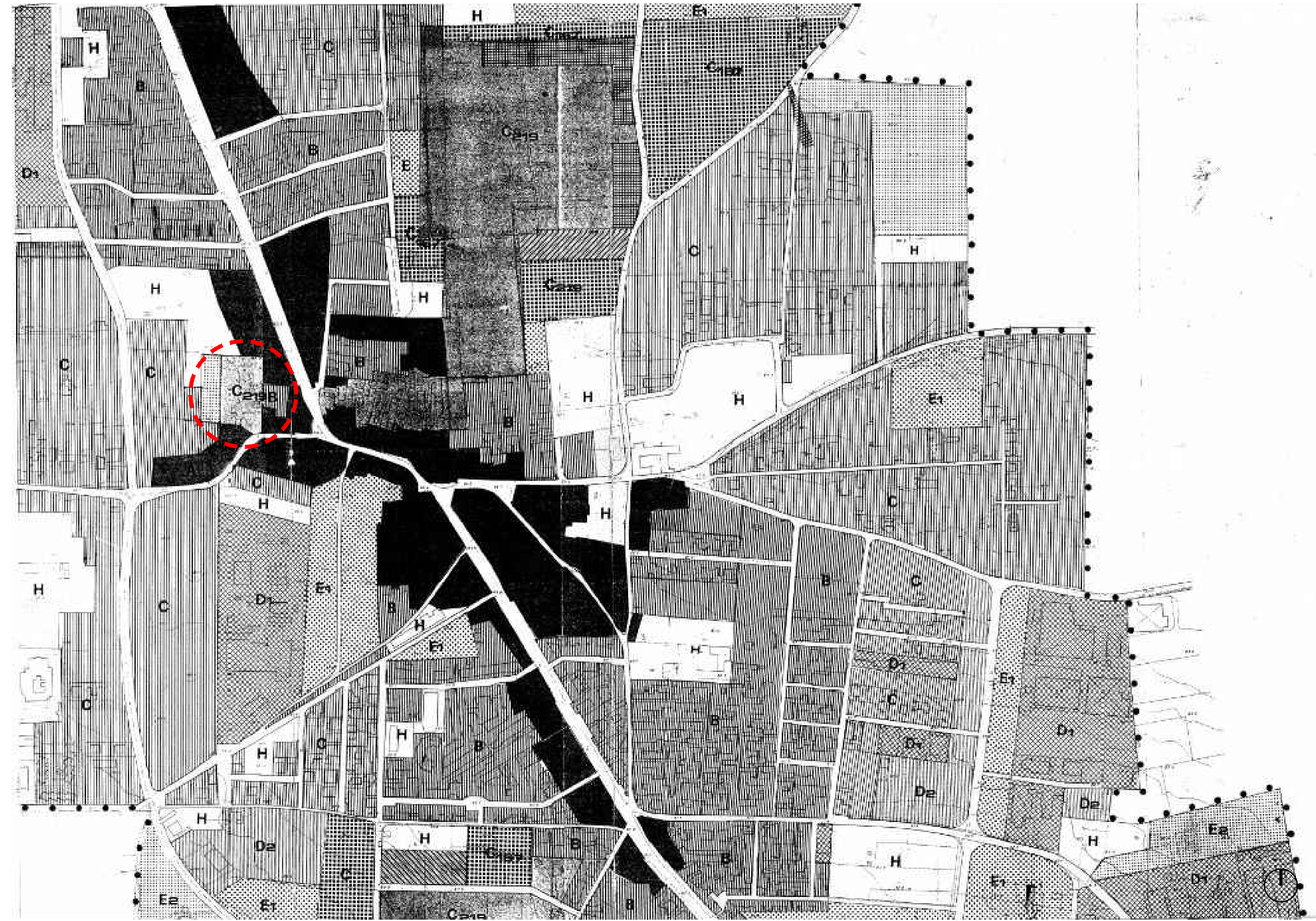
Stralcio PRG Comune di Melito

Comune: Melito Lotto: Via Casa Martino Codifica: MLT Superficie: 7000mq