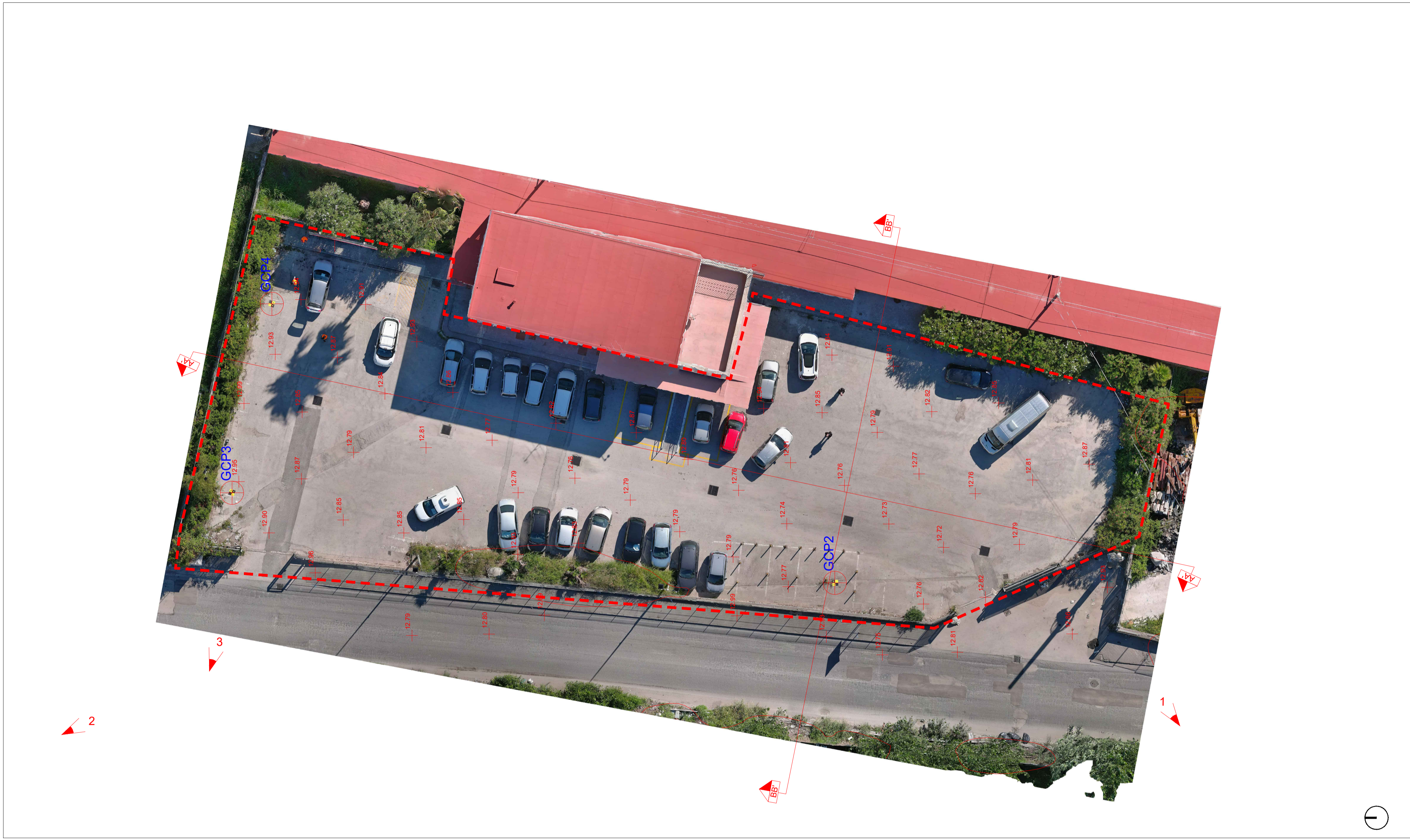
Ortofoto - stato di fatto - scala 1:200