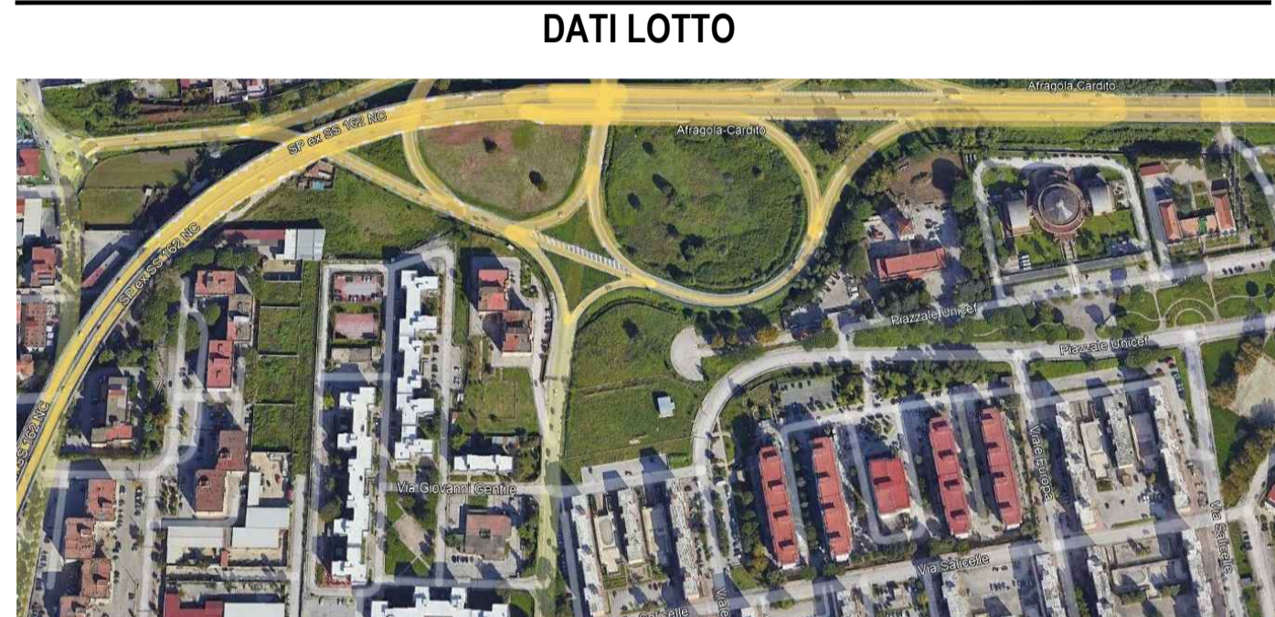
Comune: Afragola Lotto: Rione Salicelle Codifica: AFG Superficie: 9000mq